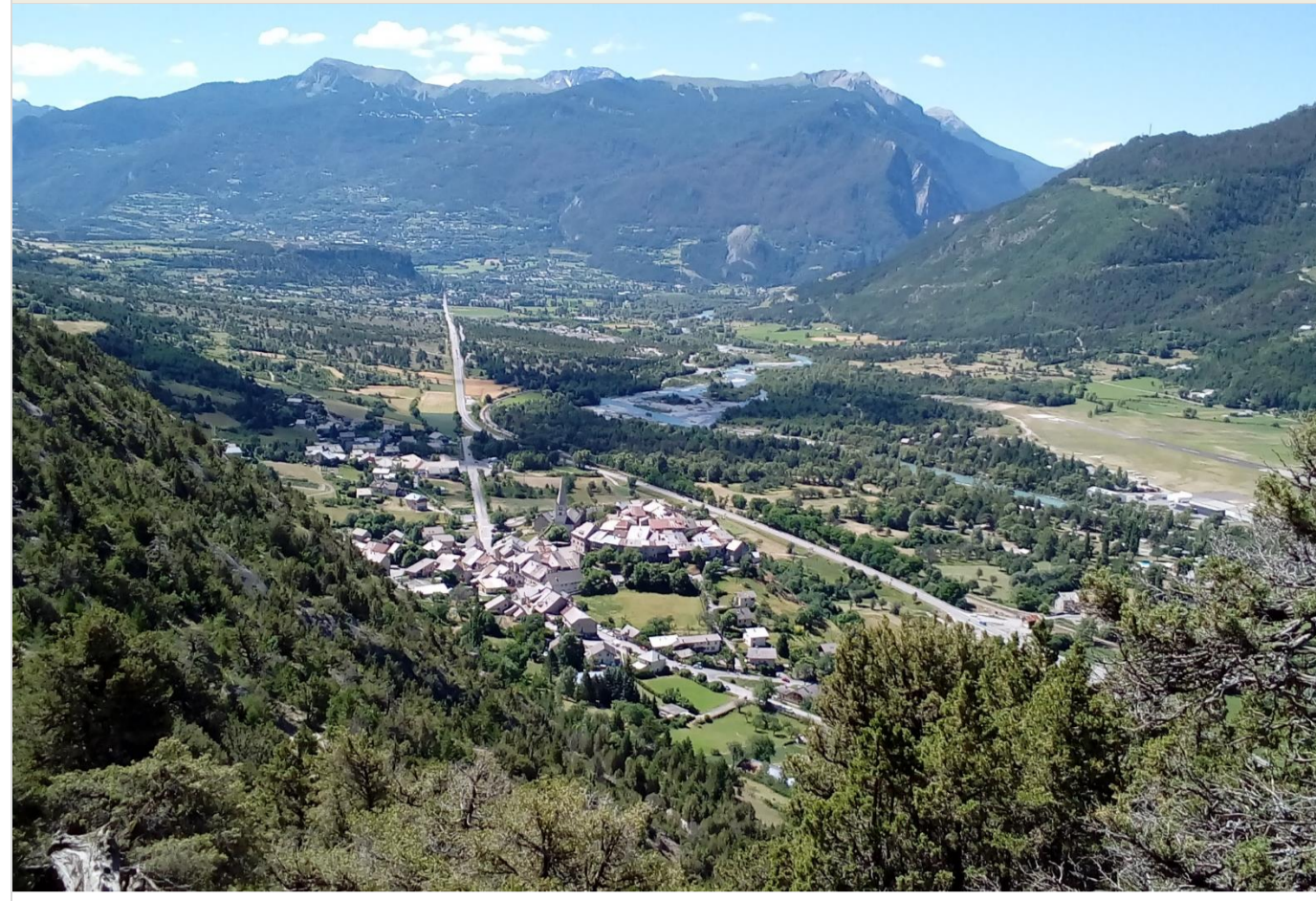
42. DOCUMENT GRAPHIQUE – PLAN D'ENSEMBLE

Révision générale du PLU approuvée le : 28 Juin 2019